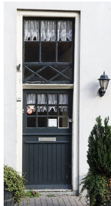
Jufferenstraat 1, Elburg, 8081 CP, Elburg, Gelderland, Nederland, Maker: J. van Galen Bron: Rijksdienst voor het Cultureel Erfgoed