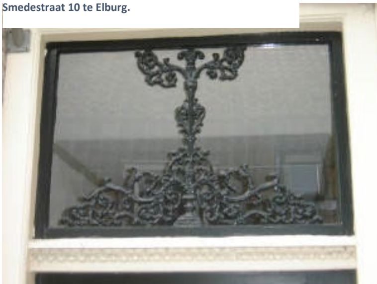
Smedestraat 10 te Elburg.

Ook in Elburg zijn er een paar hele mooie bovenlichten. De pijlen verwijzen naar de 7 Provinciën. Boven in een ruitteken. Het acanthusblad boven vormt hartjes. Onderin verbeeldt het de ING-rune. ( https://runen-cursus.nl/runen/inguz/ )