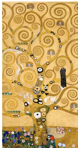
Levensboom van Gustav Klimt